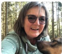
Pastoralreferentin (MagTheol.) / Tierethikerin (MA)